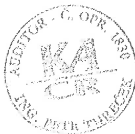
Ing. Petr Tureček auditor č. oprávnění 1830 Brno, Chládkova 2, PSČ 616 00